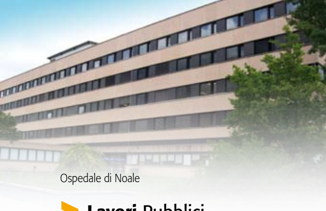
Ospedale di Noale