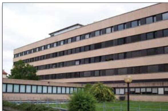
L'ospedale di Noale

In previsione di una nuova riorganizzazione sanitaria del territorio, ritengo mature le condizioni per la rivalutazione del sito ospedaliero della città di Noale. La storica sede noalese dell'Ospedale Civile P. F. Calvi dispone di strutture nuove e mai utilizzate secondo le potenzialità ivi contenute, gode di spazi preziosi per ricevere quelle specializzazioni mediche secondo una nuova pianificazione delle specificità sanitarie territoriali. Il presidio ospedaliero noalese può ad esempio rispondere alle cure mediche legate alla lungodegenza, o alle terapie riabilitative. Tutto ciò anche in considerazione del fatto che la nuova geo-