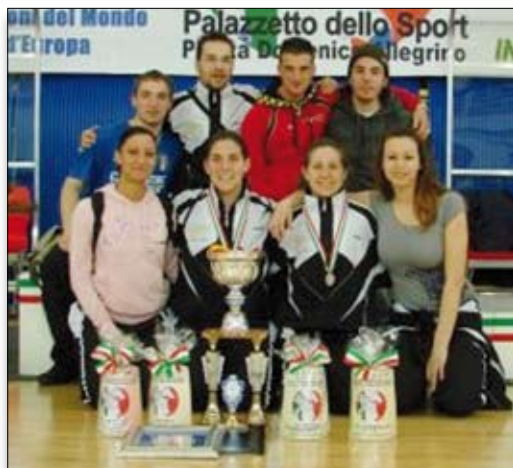
Società vice campione assoluta d'Italia

Vice Campione d'Italia Assoluto - Campione d'Italia Junior Femminile