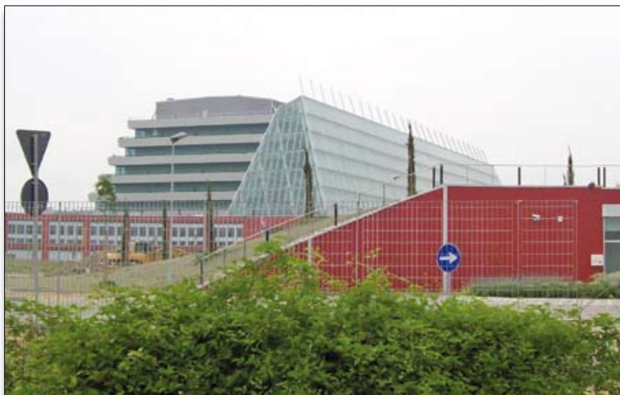
Il nuovo ospedale di Mestre

L'insediamento del nuovo ospedale apre una nuova stagione per la sanità territoriale, dove la distribuzione geografica dei presidi ospedalieri, e mi riferisco all'Ulss 13 (Noale, Dolo, Mirano) dovrà necessariamente integrarsi a quella dell'Ulss 12 (Mestre-Venezia) e le specializzazioni dovranno risultare complementari se si vuole far fronte ad un territorio ormai privo di un centro. Non dimentichiamo le sofferenze croniche legate ad esempio alla viabilità, basti pensare ai tempi di percorrenza per raggiungere i servizi in rapporto all'urgenza