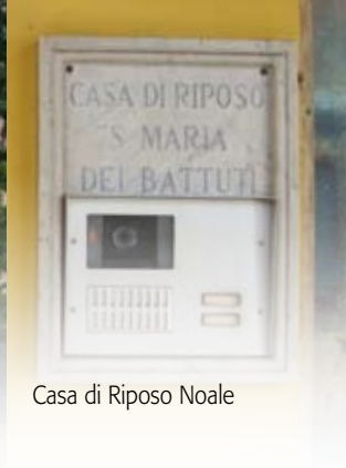
Casa di Riposo Noale